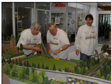
Die Modellbahnfreunde in „Action“.

Die M B F –2000 Rheingold sind nicht nur ein Verein, sondern in jedem Fall ein Freundeskreis im besten Sinne des Wortes. Wir treffen uns einmal im Monat um unsere Erfahrungen auszutauschen und die gemeinsamen Aktivitäten zu besprechen und zu planen. Wir haben uns nicht einer speziellen Spurweite verschrieben. Die M B F-2000 Rheingold sind offen für alle Modellbahner . Zu unseren Mitgliedern zählen alle Liebhaber der kleinen Bahnen von der kleinsten Spur