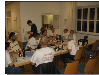
Die Modellbahnfreunde 2000 Rheingold nicht immer bei „der Arbeit“!

Landschaftsgestalter. Techniker. Elektroniker. Organisatoren. Für jeden Bereich haben wir unsere Spezialisten. Uns geht es auch um eine gute Kameradschaft. Und so reden wir nicht nur über unser Modellbahnhobby. Wir reden auch gerne Mal über andere Dinge.