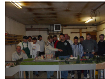
„Bauaktivitäten“ an einer Modulanlage

Modellbahnbegeisterung, ist allein schon ein guter Grund sich zu treffen. Regelmäßige Treffen. Meinungs- und Erfahrungsaustausch. Günstige Beschaffung von Modellbahnzubehör durch Sammeleinkauf. Tausch und Pflege von Modellen. Erweiterung unserer Module , die wir auf verschiedenen Ausstellungen präsentieren .