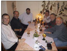
Der „erste Märklin-stammtisch“ tagt.

Im Jahre 2000 fanden sich eine Reihe von Modellbahnern aus der Region Bad Salzig/ Rhein . Sie beschlossen Ihre Interessen und Erfahrungen gemeinsam zum Nutzen ihres Hobbys Modelbahn anzuwenden. Am 08.11.2000 traf man sich zum ersten Stammtisch . Am 11.05.2001 beschlossen diese sich den Namen: „Modell Bahn Freunde Rheingold“ zu geben. Seit dem gibt es die Modell Bahn Freunde Rheingold . Die in den letzten Jahren immer umfangreicheren und vielfältigeren Aktivitäten mündeten dann auch im 5. Jahr des Bestehens in die Gründung des Vereins „Modell-Bahn-Freunde-2000 Rheingold e.V.“!