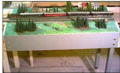
Ein Streckenmodul „Modul 1“

Unsere Anlage besteht aus den Streckenmodulen (Gerade und Kurven) sowie den Bahnhofs- und Sondermodulen.